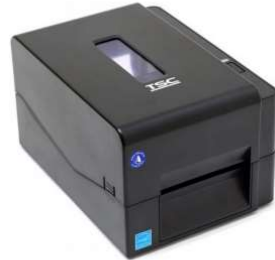
Принтер этикеток TSC TE200 13 474 руб.