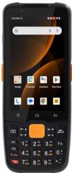
Терминал сбора данных MERTECH MovFast S40 25 234 руб.