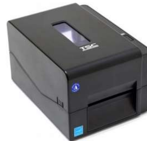
Принтер этикеток TSC TE200 13 474 руб.