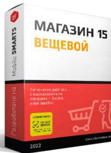
Mobile SMARTS Магазин 15 ВЕЩЕВОЙ, БАЗОВЫЙ 21 250 руб.