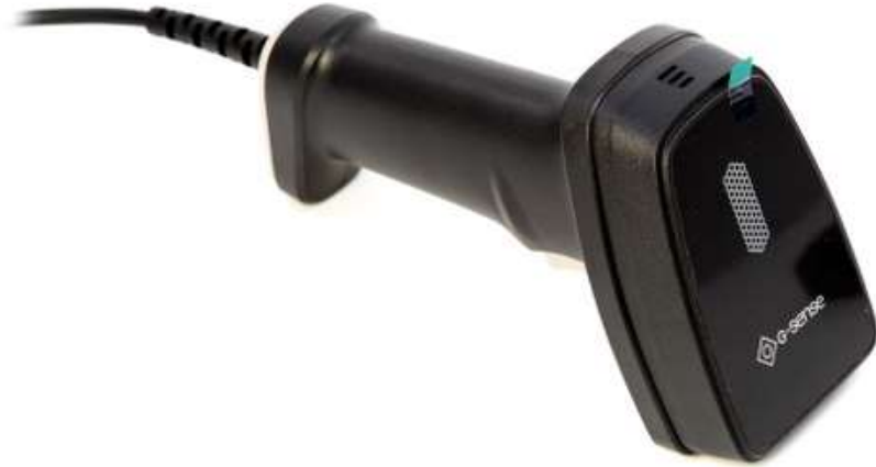
Сканер штрихкода G-SENSE IS1402HD 4 180 руб.